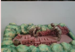
Der Künstler Bernd Maro Der Schuster in Preetz, der Schusterstadt des Nordens

Der Torfabbau wird bald beendet sein und die türkischen Torfarbeiter werden die letzten sein, die die Torfsoden stapelten und den getrockneten Torf zur Weiterverarbeitung in die Werke führen