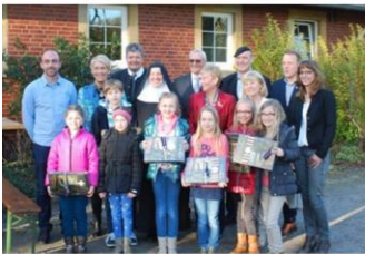
Schülerprojektgruppen des KVG Haus Dinklage rechts und der KVG Grundschule Dinklage links